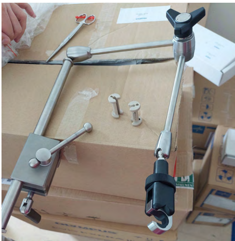
fül-orr-gégészeti sebészeti eszközök