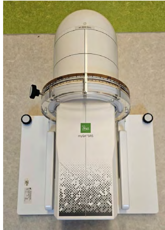
teleterápiás dozimetria, komplett eszközpark