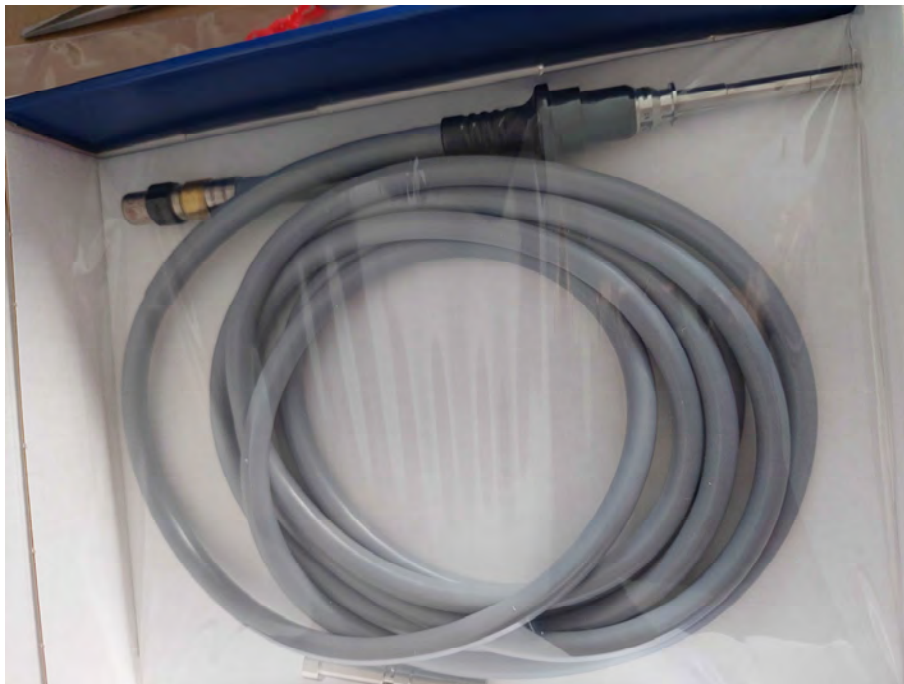
fül-orr-gégészeti sebészeti eszközök