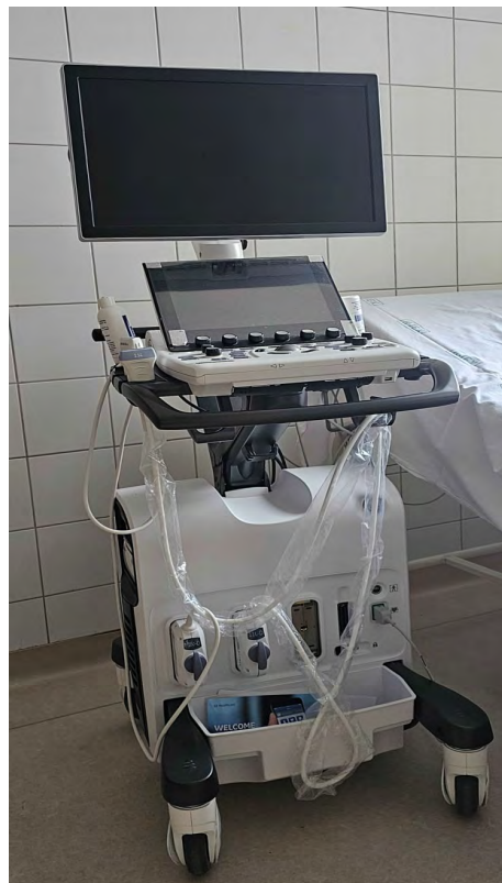
kardiológiai ultrahang készülék