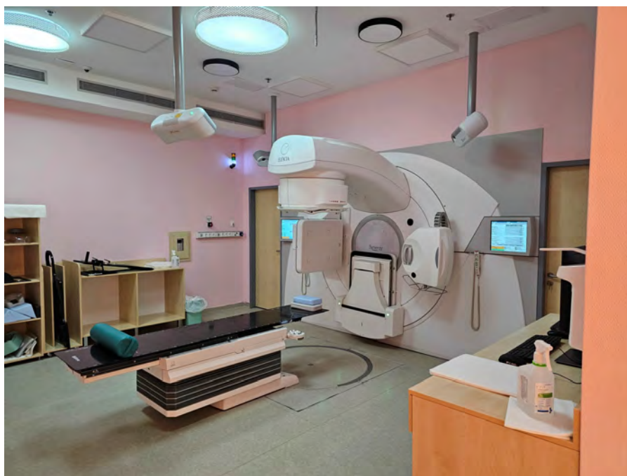
stereotaxiás és linearis gyorsító upgrade